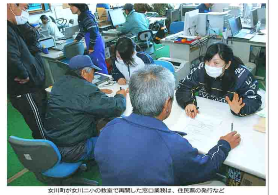
女川町が女川二小の教室で再開した窓口業務は、住民票の発行などごく一部にとどまっている

住民の異動が把握できず、戸籍データが空白になった。被災地の住民の異動が把握できず、戸籍データが空白になった。