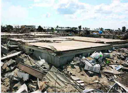
土台だけが残った民家。境界はがれぎりに埋もれ判別できない —仙台市若林区荒浜

「土地境界」を調査する。市町村の調査率は、宮城県が88%、仙台市が79%、多賀城市が100%、塩釜市が92%、東松島市が95%、石巻市が96%、気仙沼市が92%、青森県が93%、岩手県が85%、秋田県が48%、山形県が59%、福島県が45%、全国平均が49%。