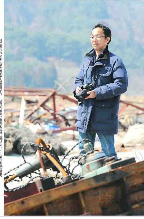
釜石市七部から北、トノガ希の種アヲ心象。10月6日、釜石を去った。絶えず持ちこたれた。家族は無事。今は、新しい生活を送っている。