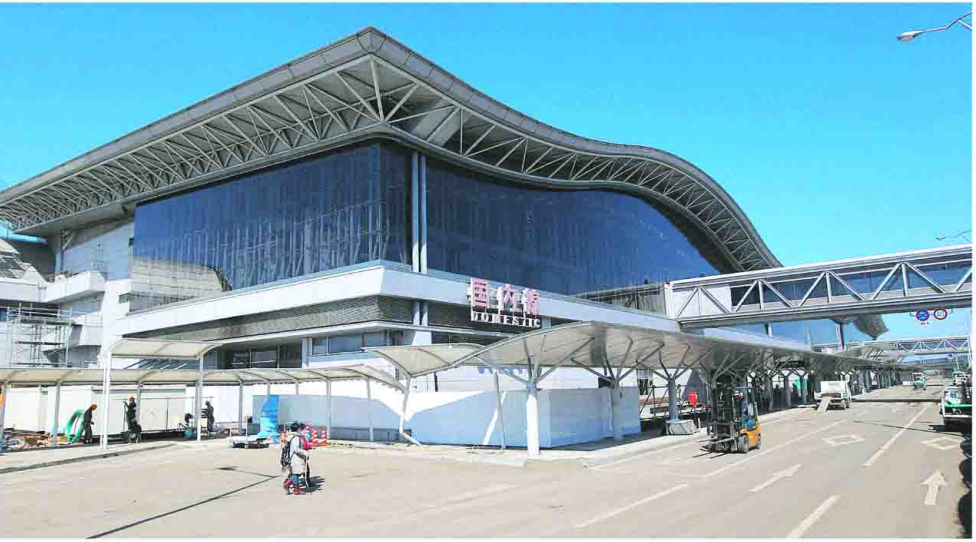
4月中旬に開業予定の仙台空港新ターミナルビル。1号棟は1時30分ごろ

東日本大震災の大津波で冠水した仙台空港は、今月に、一部国内線を再開する運びとなった。東部新幹線は、1日、仙台から盛岡までの区間が再開された。宮城県の仙台空港は、4月5日、仙台から盛岡までの区間が再開された。仙台空港は、4月5日、仙台から盛岡までの区間が再開された。